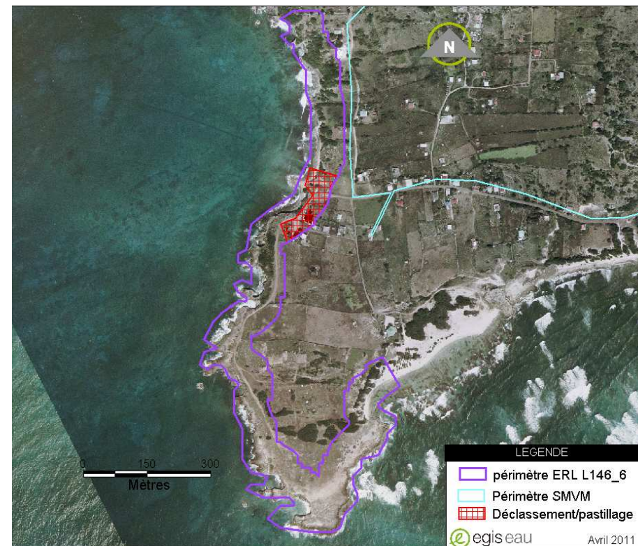
Projet de modification du périmètre

Le périmètre doit être ajusté au projet de déclassement du SAR/SMVM de la Guadeloupe.