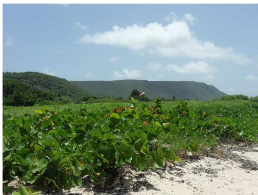
Vue sur les plateaux de la Désirade depuis la Pointe des Colibris