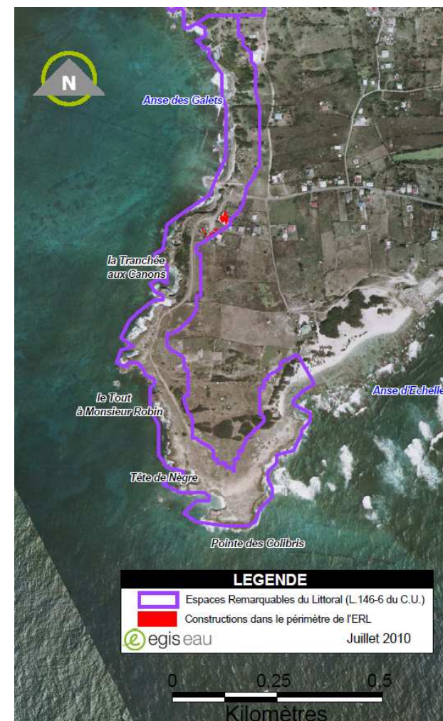
Construction dans le périmètre de l'espace remarquable

Au niveau de l'Anse des Galets, les activités humaines ont colonisées cette extrémité de la Désirade avec la déchèterie communale, différentes habitations ainsi que l'atterrage de la canalisation d'eau potable en provenance de la Grande Terre.