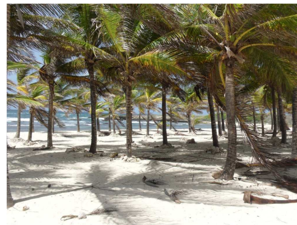
Vue sur la Pointe des Colibris depuis l'Anse l'Echelle