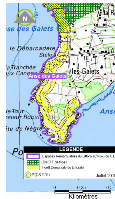
Outils de protection et de gestion